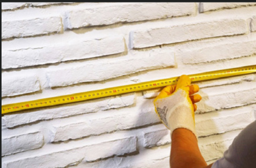
02 ANZUBRINGENDE PANELE AUSMESSEN SCALING OF THE PANEL TO BE APPLIED