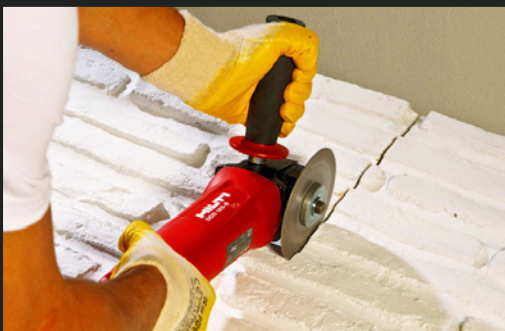
03 PANELE MIT WINKELSCHLEIFER ZUSCHNEIDEN CUTTING THE PANEL BY ANGLE-GRANDER