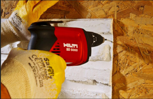
04b ANBRINGEN DURCH SCHRAUBEN ASSEMBLING BY SCREWS