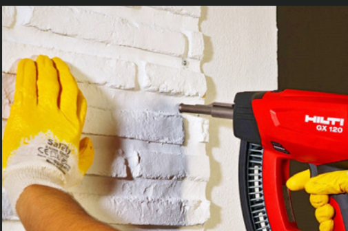
04a ANBRINGEN MIT NÄGELN ASSEMBLING BY NAILS