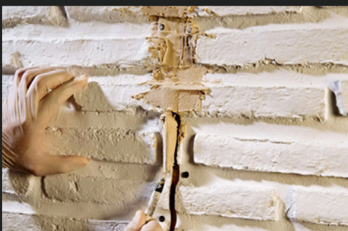
07 ZWISCHENRÄUME MITHILFE EINES SPACHELMESSERS MIT SPACHELMASSE FÜLLEN COVERING THE SPACES BY ASSEMBLY PUTTY BY USING A PUTTY KNIFE