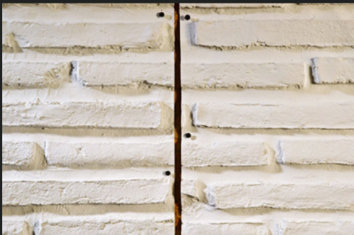
05 ABSTAND VON CA. 1 CM ZWISCHEN DEN PANEELN FREI LASSEN LEAVING A SPACE BY 1CM BETWEEN TWO PANELS