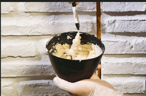
06 SPACHELMASSE VORBEREITEN PREPARING THE ASSEMBLY PUTTY